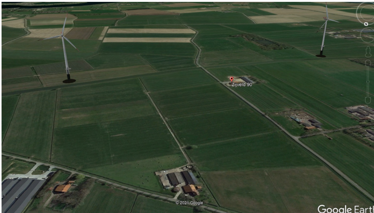
3. Bovenaanzicht Mosterdwal / Zijveld